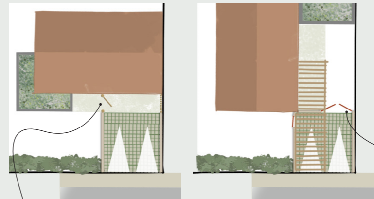
Portillon en limite de l'aire de stationnement

Deux places de stationnements aériennes devront être créées à l'emplacement indiqué sur le plan. Elles respecteront les dimensions indiquées et resteront non closes depuis l'espace public.